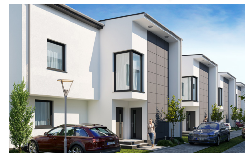
Widok od strony ulicy